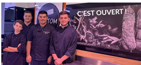
BOUCHERIE CHARCUTERIE SOTTOM 7 Avenue du Commandant Taillefer