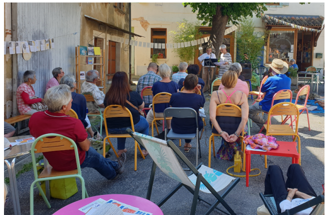
"apéro-lecture du samedi 17 juin par le groupe de lecteurs à voix haute de la médiathèque"

Des moments conviviaux ouverts à tous et toujours gratuits, venez nous voir!