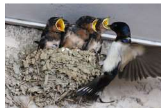
hirondelles de fenêtre

Elles font parties de nos habitantes tous les étés. Ce sont des oiseaux protégés sur le territoire français et pourtant leurs effectifs chutent : baisse de 40% pour l'hirondelle de fenêtre et de 8% pour l'hirondelle rustique. Il est fortement conseillé de préserver leurs nids. Un arrêté ministériel interdit de détruire les individus, les nids et les oeufs, les poussins ou de les perturber intentionnellement. Ces oiseaux sont insectivores, ils se nourrissent entre autres des moustiques et participent à la quiétude de nos soirées estivales.