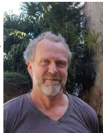
membre du groupe Ville Verte

Concernant l'installation de récupérateurs d'eau pour particuliers : nous pourrions nous regrouper pour acheter des récupérateurs d'eau et bénéficier d'un tarif privilégié, contact : peter.ghysbrecht0359@orange.fr