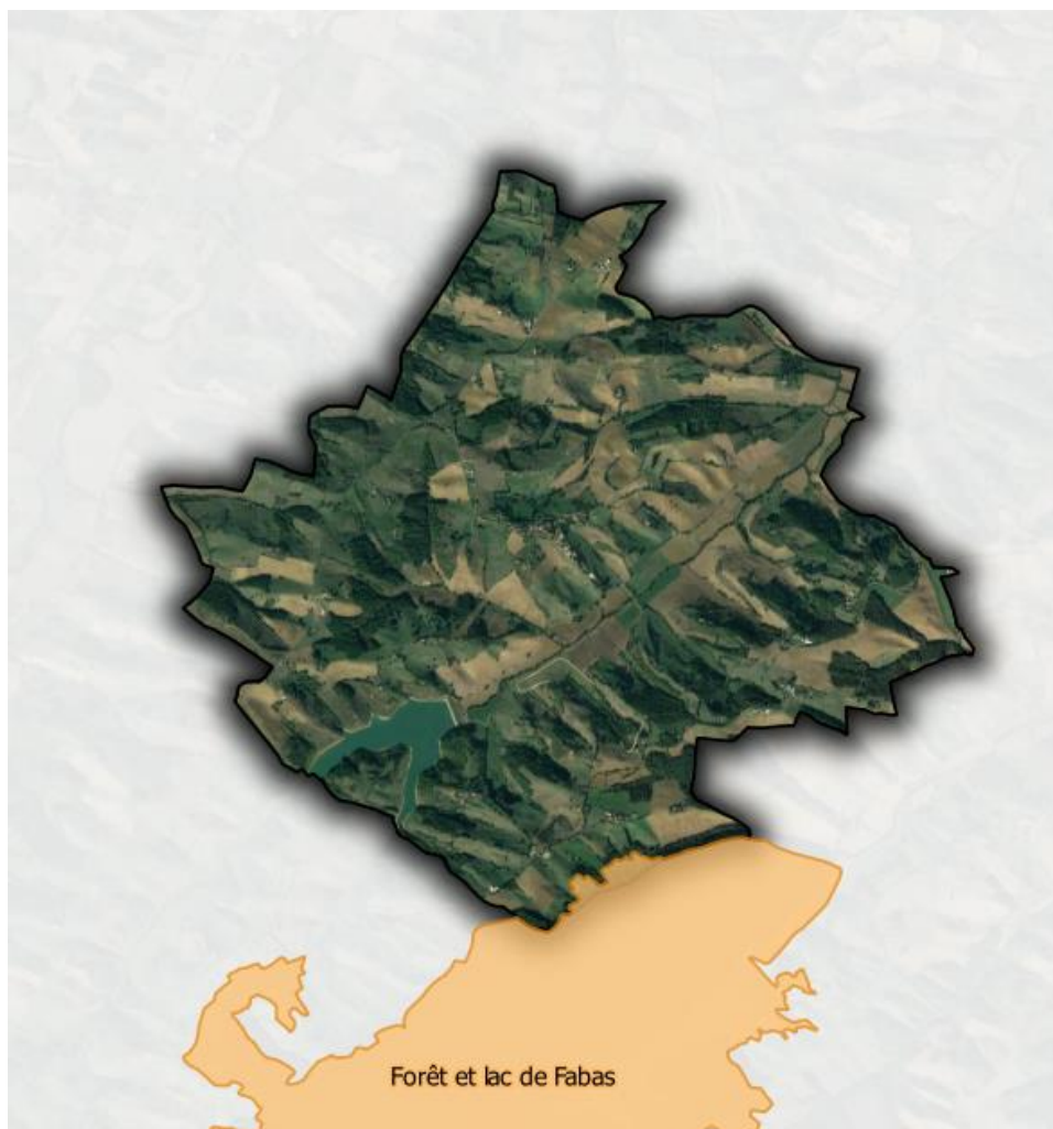
Fig. 1. Localisation des ZNIEFF sur le territoire communal