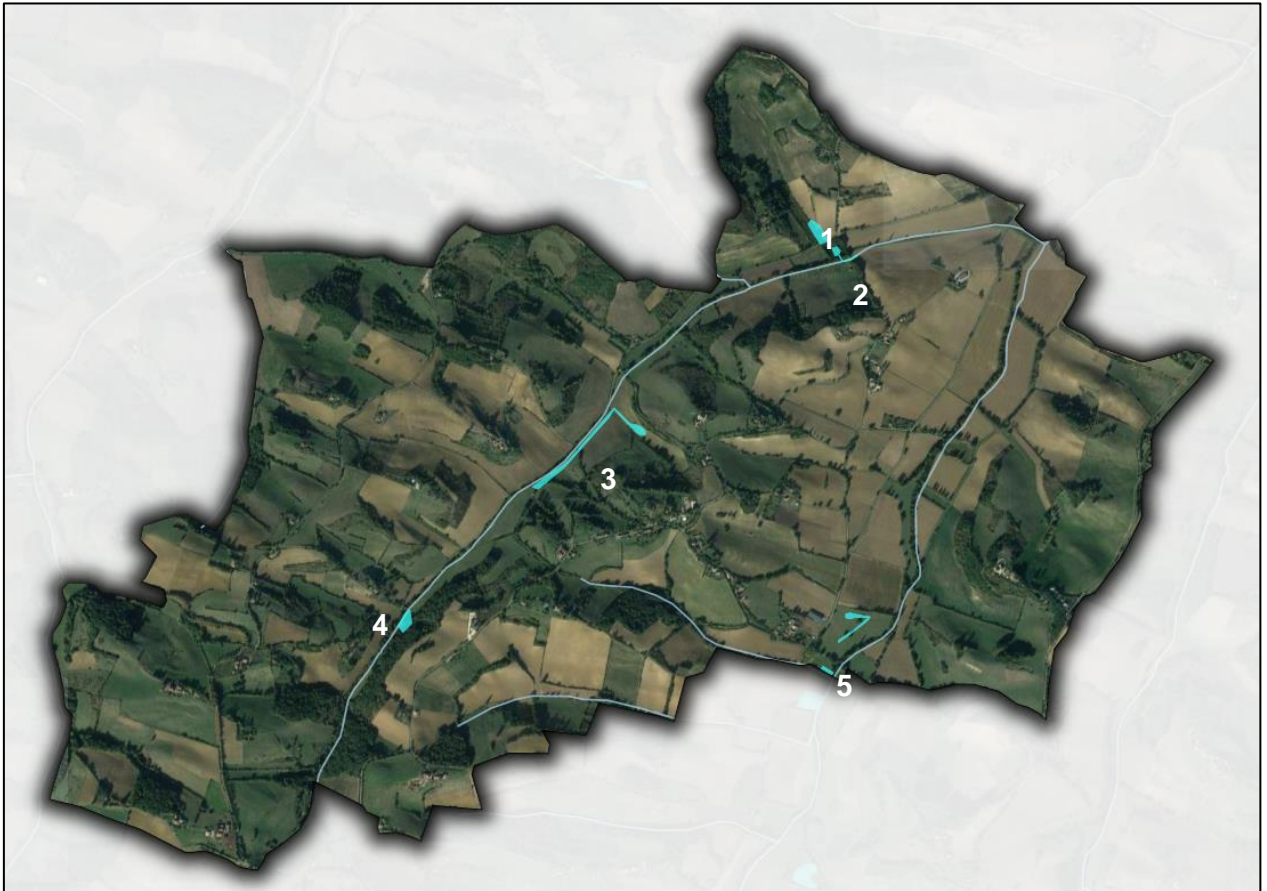
Fig. 2. Localisation des zones humides